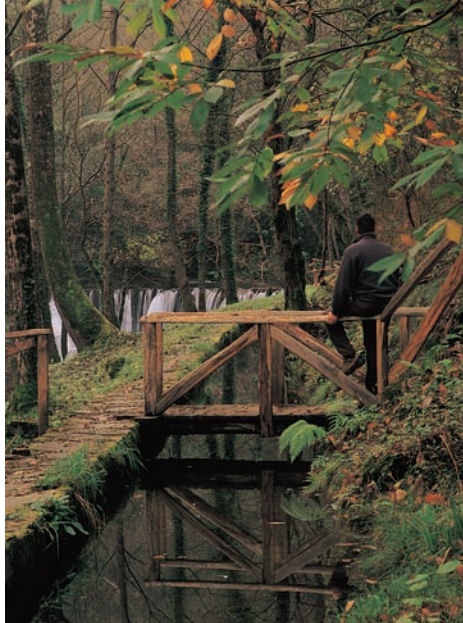
mazo de Meredo

Retomando de nuevo la senda nos dirigimos a Arcilo acompañados durante todo el recorrido por el Río Suarón , que vierte incansablemente sus aguas a la Ría del Eo , destacada por su importante valor ecológico y ornitológico. La ruta discurre muy próxima a la casona de Sestelo , edificio emblemático de la comarca. De regreso hacia Piantón tendremos una buena vista del valle, un paisaje muy humanizado donde podremos ver prados, tierras de labor, repoblaciones, etc.