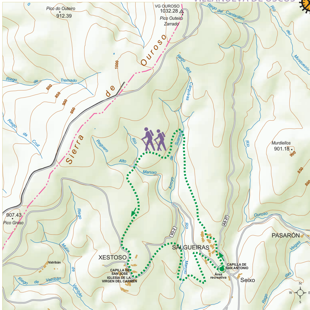
RUTA DEL CARBAYAL DE SALGUEIRAS · PR-AS 215